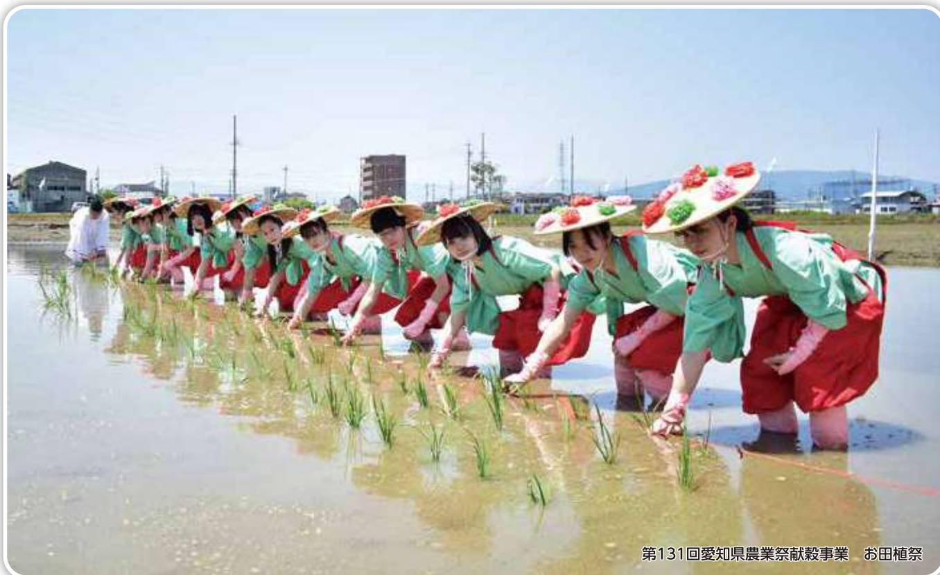
第131回愛知県農業祭献穀事業 お田植祭