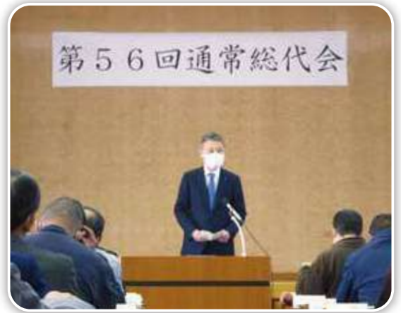
古本副知事による挨拶