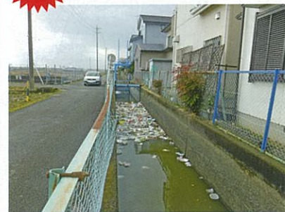
ゴミ投棄防止にご協力をお願いします。