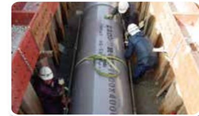
八開地区 開治支線管水路布設状況