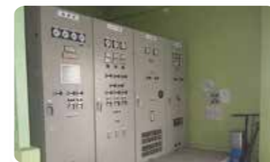
【竹之郷揚水機場】更新した配電盤(写真左)とポンプ吊上装置の設置(写真右)