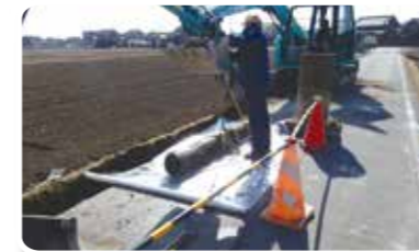
石綿管撤去状況(写真左)と新設管布設状況(写真右)