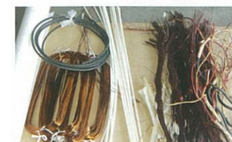
コイルの交換(右は古いコイル)