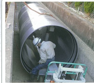
(FRPM管 φ1,500mm 配管工事)