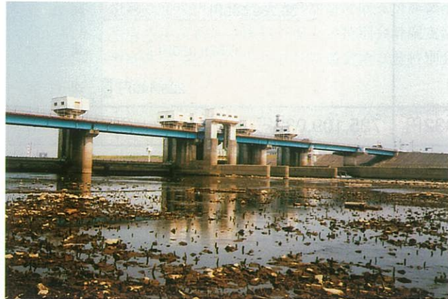
渇水の木曾川大堰

平成6年のかんがい期は、小雨に始まり、引き続きまとまった降雨もなく、夏の猛暑が加わって9月に雨が降るまで、木曾川の流況は過去最低のレベルを推移しました。そのため、度重なる節水強化が実施され、利水者にとっては、非常に厳しい年となりました。